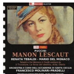
Puccini – Manon Lescaut – 1952/1956 Tebaldi, Del Monaco Orch. di Santa Cecilia/ Molinari-Pradelli WS 121.125 Pris 98:-/2 CD