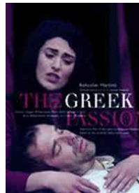
The Greek Passion – Opera in 4 acts Soloists, Prague Philharmonic Choir Kühn Children's Choir Brno Philharmonic Orch./Mackerras SU 7014-9 Pris 250:-/DVD