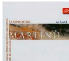
Martinu - Symphonies No 3 and No 4 Czech Philharmonic Orchestra Jiri Belohlávek SU 3631-2 Pris 139:-/CD