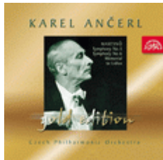
Martinu Symphonies No 5 & No 6 Memorial to Lidice Czech Philharmonic Orchestra Karel Ancerl SU 3694-2 Pris 99:-/CD