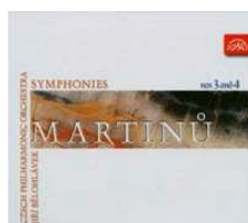
Martinu - Symphonies No 3 and No 4 Czech Philharmonic Orchestra Jiri Belohlávek SU 3631-2 Pris 98:-/CD