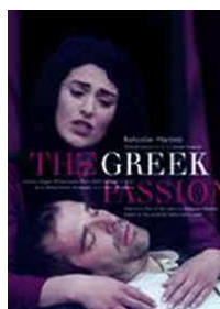
The Greek Passion – Opera in 4 acts Soloists, Prague Philharmonic Choir Kühn Children's Choir Brno Philharmonic Orch./Mackerras SU 7014-9 Pris 150:-/DVD