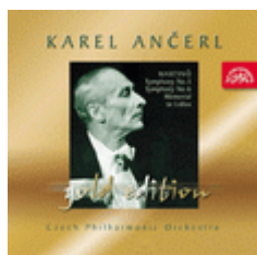
Martinu Symphonies No 5 & No 6 Memorial to Lidice Czech Philharmonic Orchestra Karel Ancerl SU 3694-2 Pris 59:-/CD