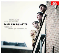
Janáček String Quartet No 1 Pavel Haas Quartets 1&3 SU 3922-2 Pris 139:-/CD

Exempel på mycket vackra pianoverk är sviterna På en övervuxen stig och I dimman .