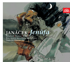
Jenufa – Opera in 3 acts A.Barová,V.Rribyl,V.Krejčík Brno Janáček Opera Orchestra & Chorus Frantisek Jílek Su 3869-2 Pris 249:-/2 CD