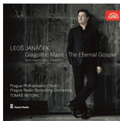
The Glagolitic Mass The Eternal Gospel Prague Radio Symph.Orch / T.Netopli SU 4131-2 Pris 98:-/CD