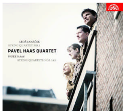
Janáček String Quartet No 1 Pavel Haas Quartets 1&3 SU 3922-2 Pris 98:-/CD

Exempel på mycket vackra pianoverk är sviterna På en övervuxen stig och I dimman .