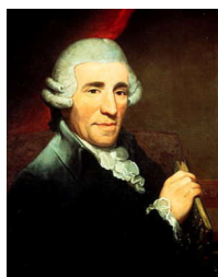
Joseph Haydn 1732-1809

Hans huvudsakliga livsgärning blev att arbeta som hovkompositör hos den furstliga ungerska familjen Esterházy. Där hade han en trygg livsförsörjning men också en stor konstnärlig frihet för sitt komponerande, och tilläts experimentera och se vad som gjorde intryck. Han kom därav att mästertligt komponera i nästan alla av klassiska epokens stilar, och blev speciellt viktig för utvecklingen av stråkkvartetterna och symfonierna , av vilka han skrev inte mindre än 104 stycken.